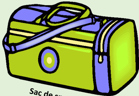
Sac de sport