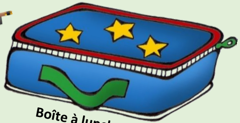
Boîte à lunch