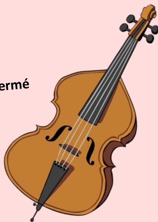
Gros instrument de musique

→ Il demeure la responsabilité du parent de transporter les objets non autorisés.