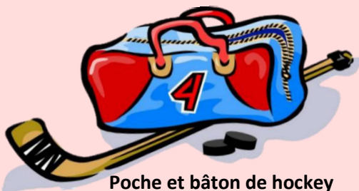
Poche et bâton de hockey