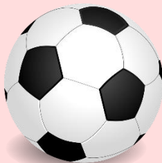
Ballon *pas dans un sac fermé