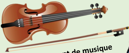
Petit instrument de musique