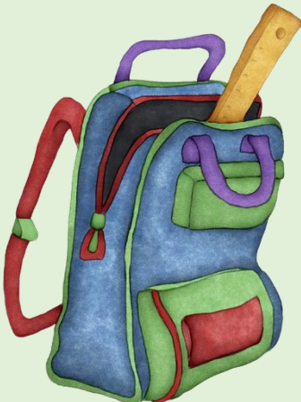
Sac à dos