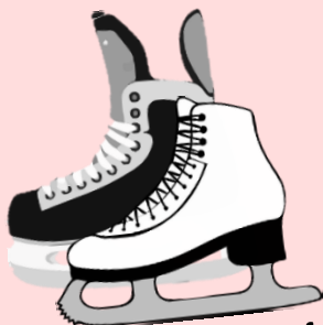
Patins *pas dans un sac fermé